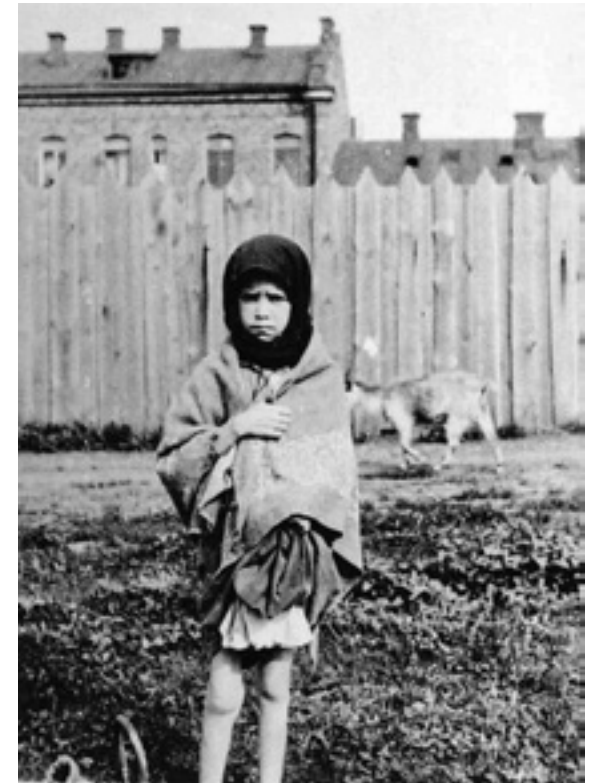
ДІВЧИНКА ІЗ ОПУХЛИМИ З ГОЛОДУ КОЛІНАМИ У ХАРКОВІ ВЛІТКУ 1933 РОКУ.

Жахом Голодомору була надзвичайно висока смертність серед дітей. У багатьох районах України у вересні 1933 року за шкільні парти не сіли близько 2/3 учнів.