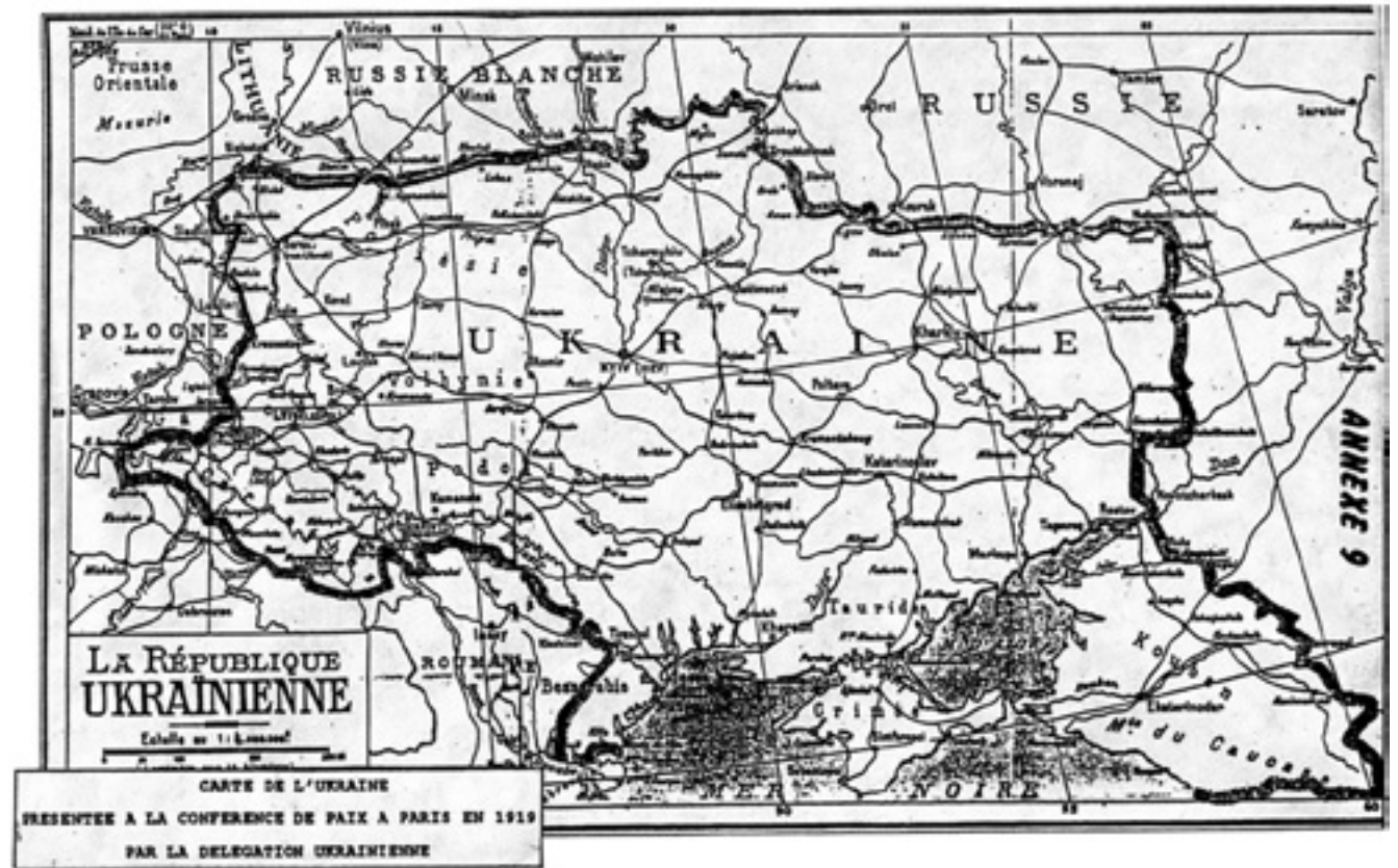
КАРТА УКРАЇНИ, ПРЕЗЕНТОВАНА НА ПАРИЗЬКІЙ МИРНІЙ КОНФЕРЕНЦІЇ 1919 Р.

Після Жовтневого перевороту 1917 року комуністи зуміли захопити владу на більшості території колишньої Російської імперії. Зокрема, окупували демократичну Українську Народну Республіку — незалежну українську державу. Цьому передувало кілька років збройної боротьби. Для того аби втриматися в Україні, комуністи змушені були піти на створення квазі-держави (Української Соціалістичної Радянської Республіки), а також на поступки українському національному рухові у сфері культури. Ці можливості українці використали сповна — у 1920-х роках в Україні відбувається стрімкий розвиток модерної культури, що орієнтується на європейські зразки, створюється національна система освіти, обґрунтовується бачення України як автономного економічного організму. З кінця 1920-х зміцнілий комуністичний режим в Радянському Союзі пішов у наступ проти цих здобутків. Сталін ставить за мету створення