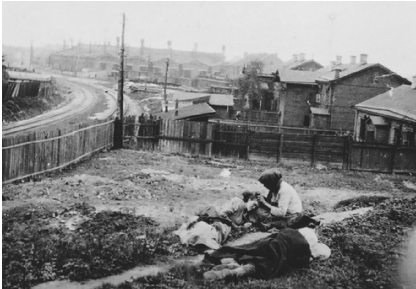
ОКОЛИЦЯ ХАРКОВА, ЛІТО 1933 РОКУ.

Внаслідок Голодомору українське суспільство, стало і значною мірою досі залишається травмованим, постгеноцидним. Десятки мільйонів людей, які пережили Голодомор, пройшли через невимовні страждання і просто не могли відкинути цього досвіду. Їхній опір було зламано, а страх повторення Голодомору залишався на довгі десятиліття та призвів до втрати впевненості й ініціативності. На свідомому та підсвідомому рівні травма Голодомору передавалася від батьків до дітей.