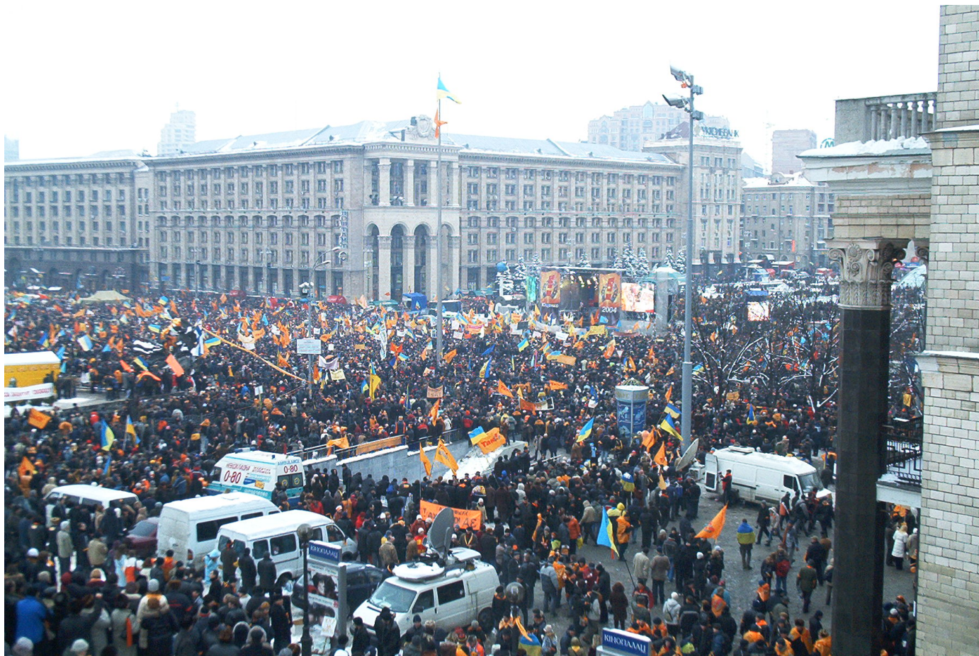
Помаранчевий майдан.