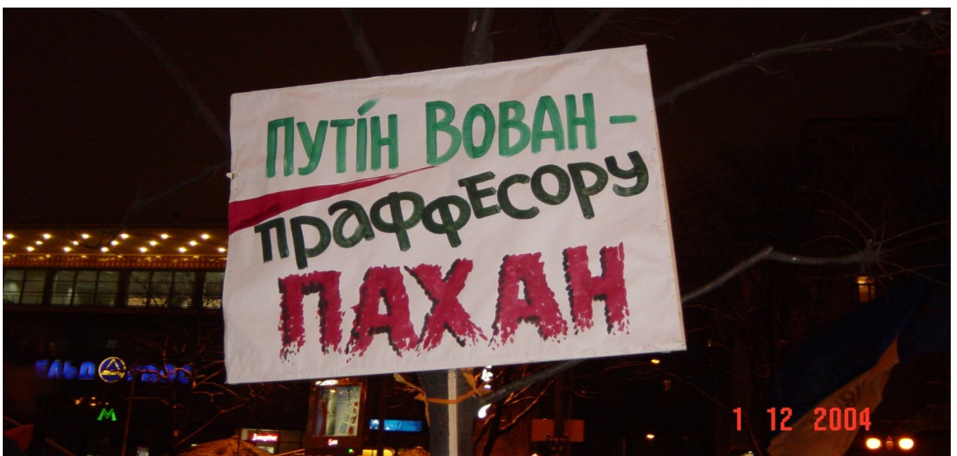
Плакат Помаранчевої революції.

Хоча Помаранчевий майдан не мав відверто антиросійського характеру, чимало його учасників усвідомлювали, в чиїх інтересах перемога Януковича та яке майбутнє може очікувати Україну, якщо він стане чільником держави. Тому серед агітаційних плакатів можна зустріти ті, які прямо вказували на російський вплив, помітний у риториці й діях Януковича та його прибічників.