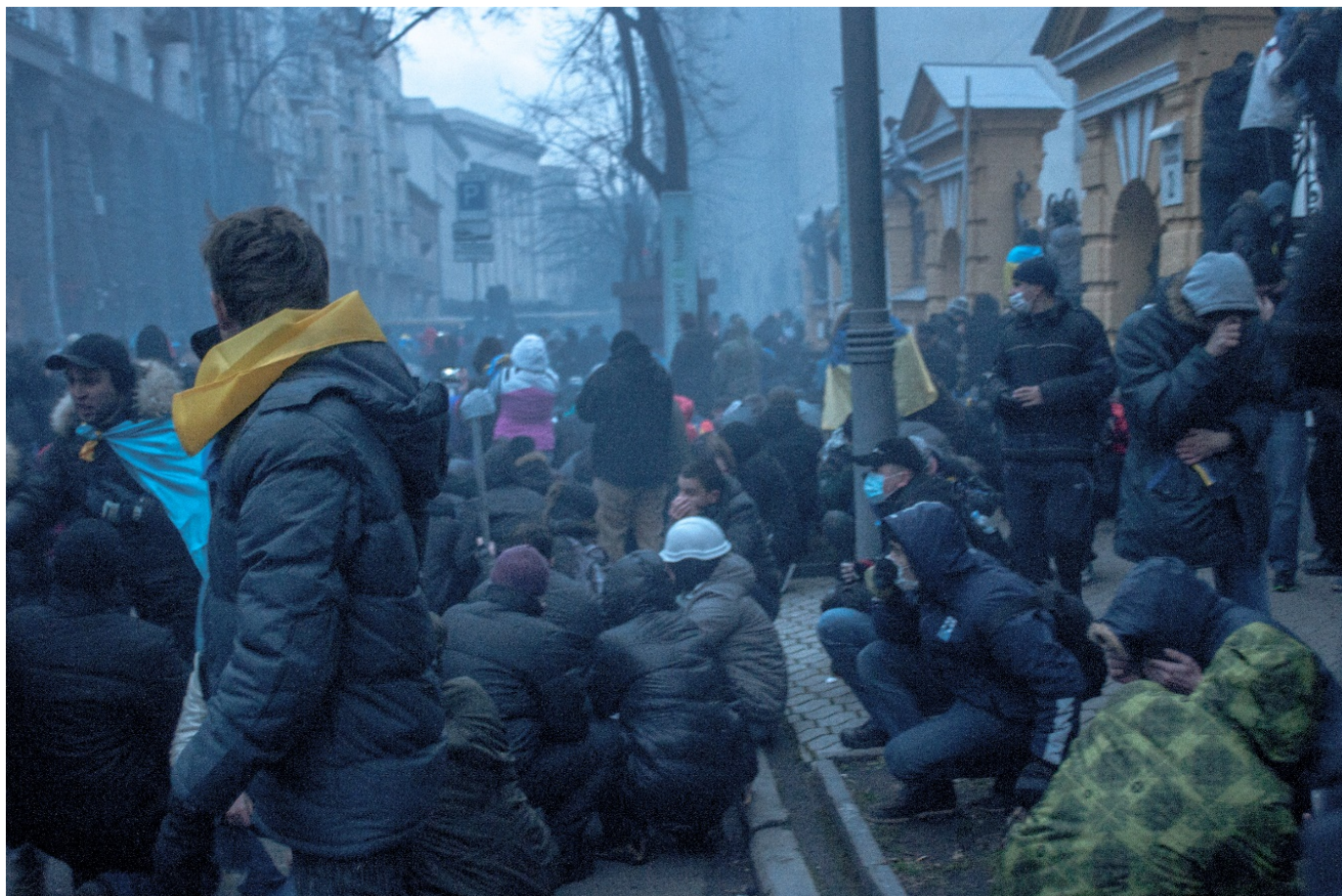
Вулиця Банкова 1 грудня 2013 року.

Цього ж самого дня протестувальники зайняли приміщення Київської міської ради та Будинок Федерації профспілок України, де розмістився новостворений Штаб національного спротиву. Рух Хрещатиком було перекрито. Там постало наметове містечко.