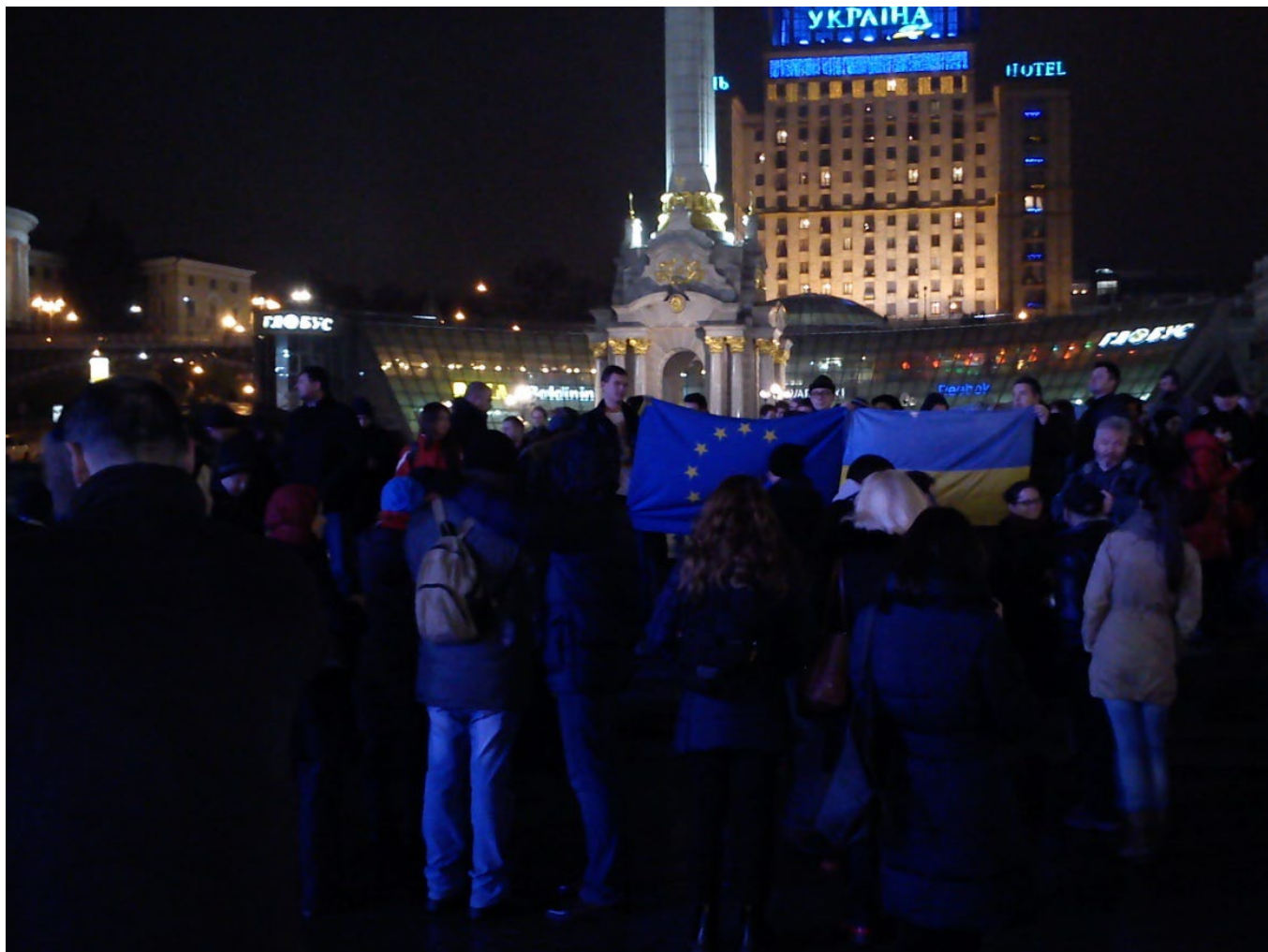
Початок Євромайдану. 21 листопада 2013 року.

За інформацією «Української правди», ближче до півночі на головній площі Києва зібралось близько 1500 осіб із прапорами України та Євросоюзу. Від майдану Незалежності вони вирушили на вулицю Банкову, яку заблокували силовики. Заспівавши гімн України під Адміністрацією президента, люди повернулися на центральну площу. Частина з них залишилася на майдані Незалежності до ранку, тим самим заявивши, що протест буде безстроковим. Маніфестантів підтримали деякі опозиційні політики, які також вирішили чергувати вночі на Майдані з метою захисту протестувальників.