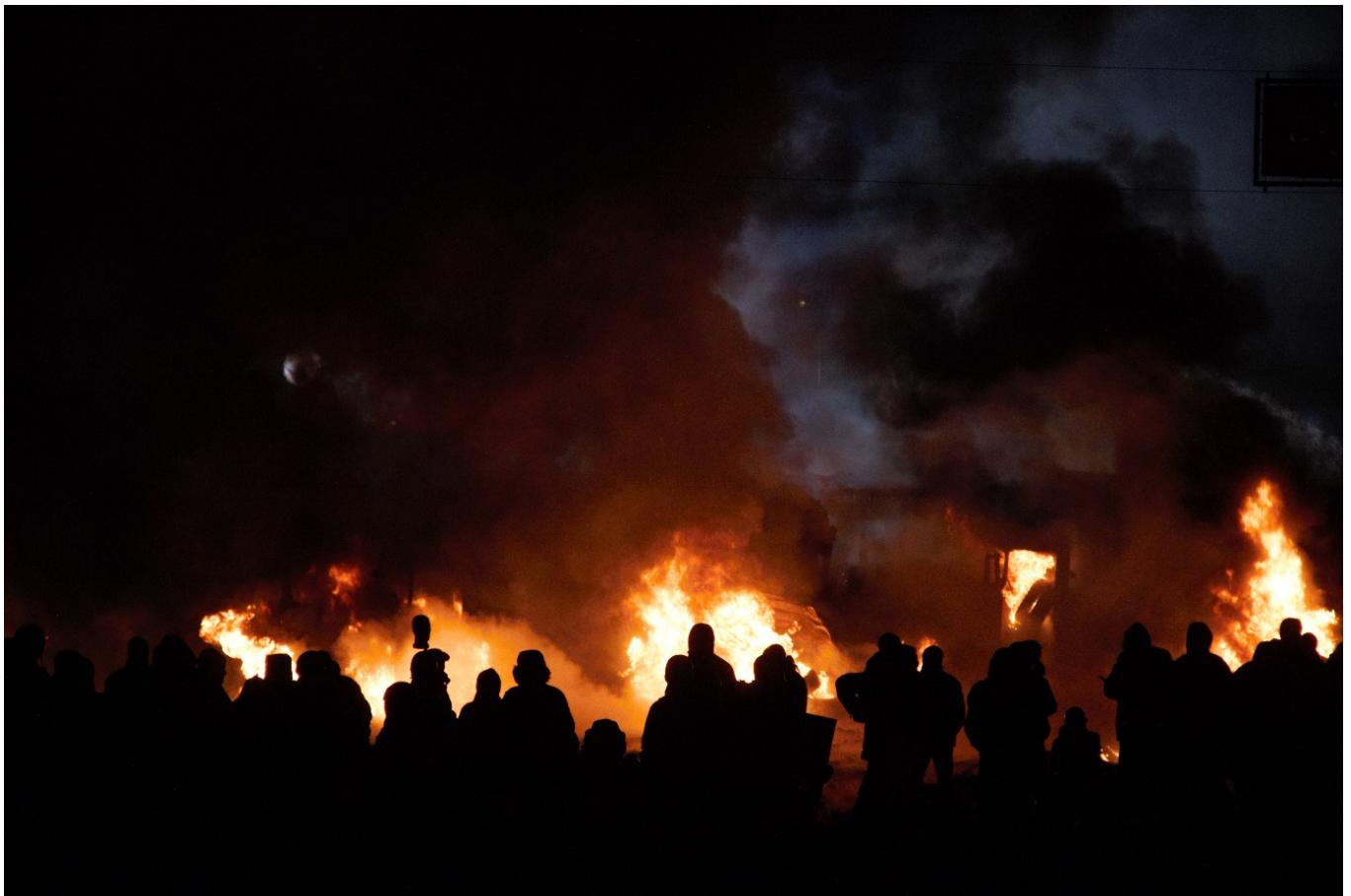
«Вогнехреща» на Грушевського.

Ухвалення «диктаторських законів», зміст яких відверто суперечив принципам демократії, призвело до радикалізації протестів. На черговому вічі 19 січня 2014 року частина його учасників, обурена згаданими законами та бездіяльністю опозиційних лідерів, вирушила до будівлі Верховної Ради. На початку вулиці Михайла Грушевського шлях їм перекрили міліція та «Беркут». Майже відразу почалися сутички. Лінія протистояння пролягла між колонадою стадіону «Динамо» та будівлею Національного художнього музею України. Міліція застосувала світлошумові гранати й інші спецзасоби. Із боку протестувальників полетіли петарди та «коктейлі Молотова». Два міліцейські автобуси, які перекривали шлях колоні, було перекинуто та спалено. Щоб стримати спроби наступу силовиків, протестувальники склали з підпалених шин вогняну барикаду. Утворилася щільна димова завіса. Міліція вдалася до помпових рушниць і водометів усупереч закону, який забороняє використовувати водомети за температури нижчої від нуля градусів за Цельсієм. Цей і наступні дні протистояння на вулиці Михайла Грушевського увійшли в історію під назвою «Вогнехреща».