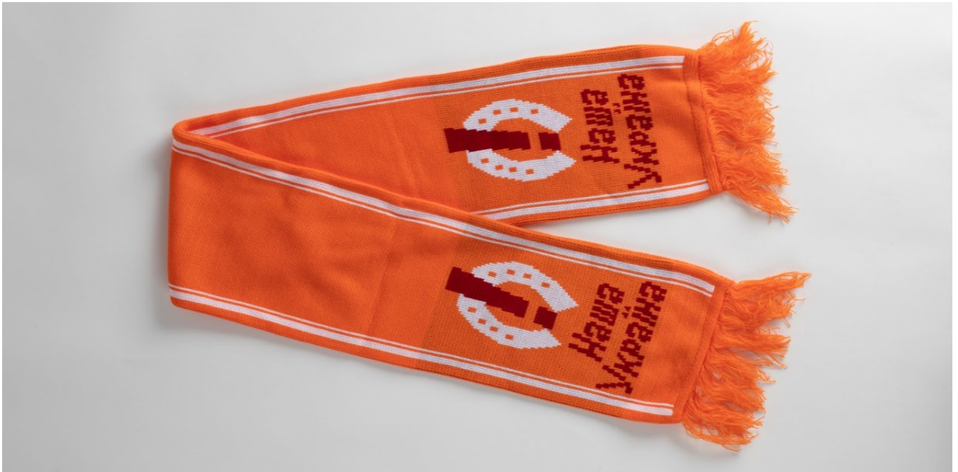
Шарф учасника Помаранчевої революції.