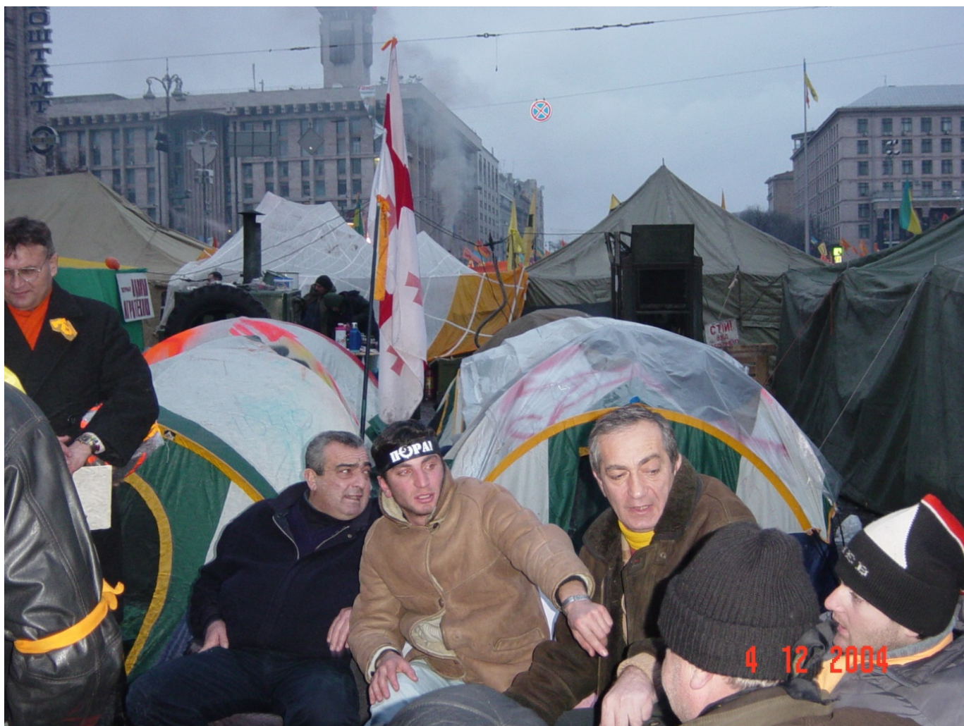
Активіст «Пори» у наметовому містечку.