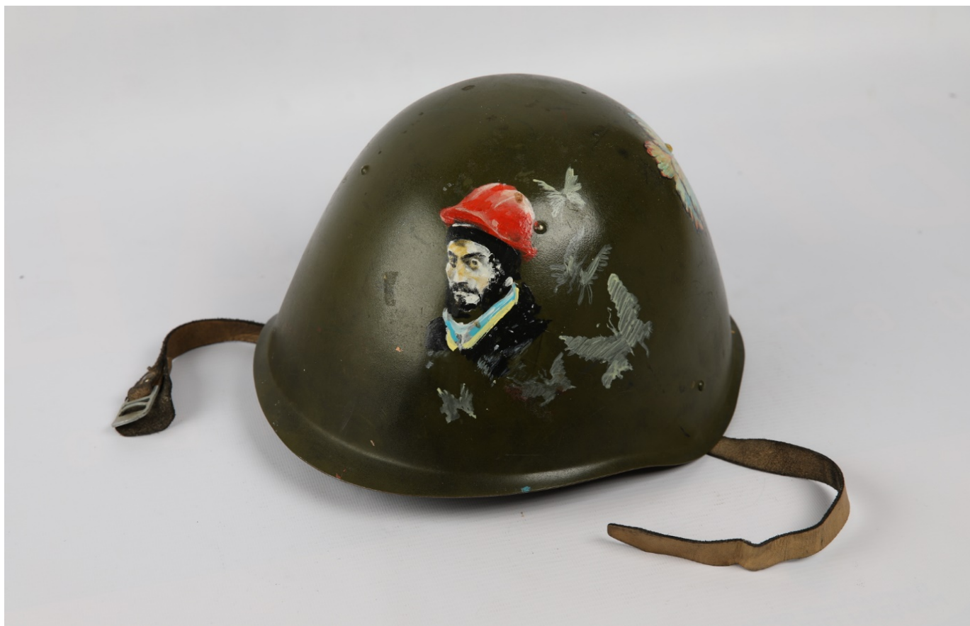
Майданівська каска з портретом Героя Небесної Сотні Сергія Нігояна.

Серед основних символів Майдану – стрічки з кольорами прапорів України та Європейського Союзу, каски та щити членів Самооборони Майдану, що не могли захистити від куль, а радше сприймалися як суто символічні засоби захисту чи як обереги. Невипадково значну кількість щитів і касок було розписано або вкрито написами.