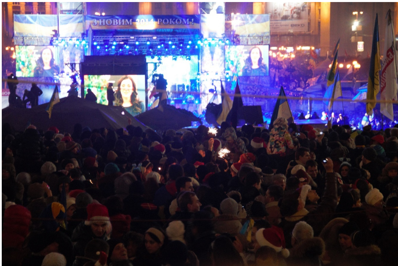
Новий рік на майдані Незалежності.

16 січня у Верховній Раді переважно силами депутатів від Партії регіонів і комуністів ухвалили пакет законів, які суттєво обмежували права громадян на протест. Суспільство відразу охрестило їх «диктаторськими». Ці закони, спрямовані проти фундаментальних громадянських свобод – свободи вияву поглядів, мирних зібрань, об'єднань, цілковито звільняли від відповідальності причетних до кривавих подій на Євромайдані та створювали правові підстави для запровадження цензури й переслідування незгодних із діями влади.