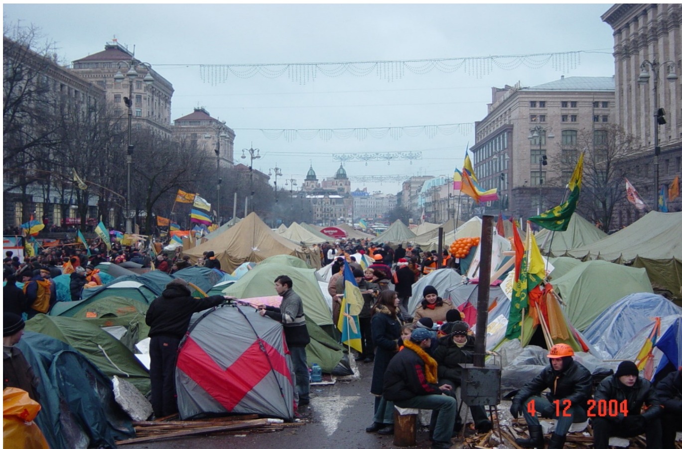
Побут протестувальників у наметовому містечку на Хрещатику.

Позачергова сесія Київської міської ради висловила недовіру Центральній виборчій комісії (ЦВК) та звернулася до Верховної Ради з проханням не визнавати попередні результати підрахунку голосів. Одночасно Київрада зобов'язала Київську міську державну адміністрацію забезпечити належні умови для проведення масових акцій у Києві та охорону громадського порядку. Того самого дня ще до оголошення офіційних результатів голосування президент росії володимир путін привітав Віктора Януковича з перемогою.