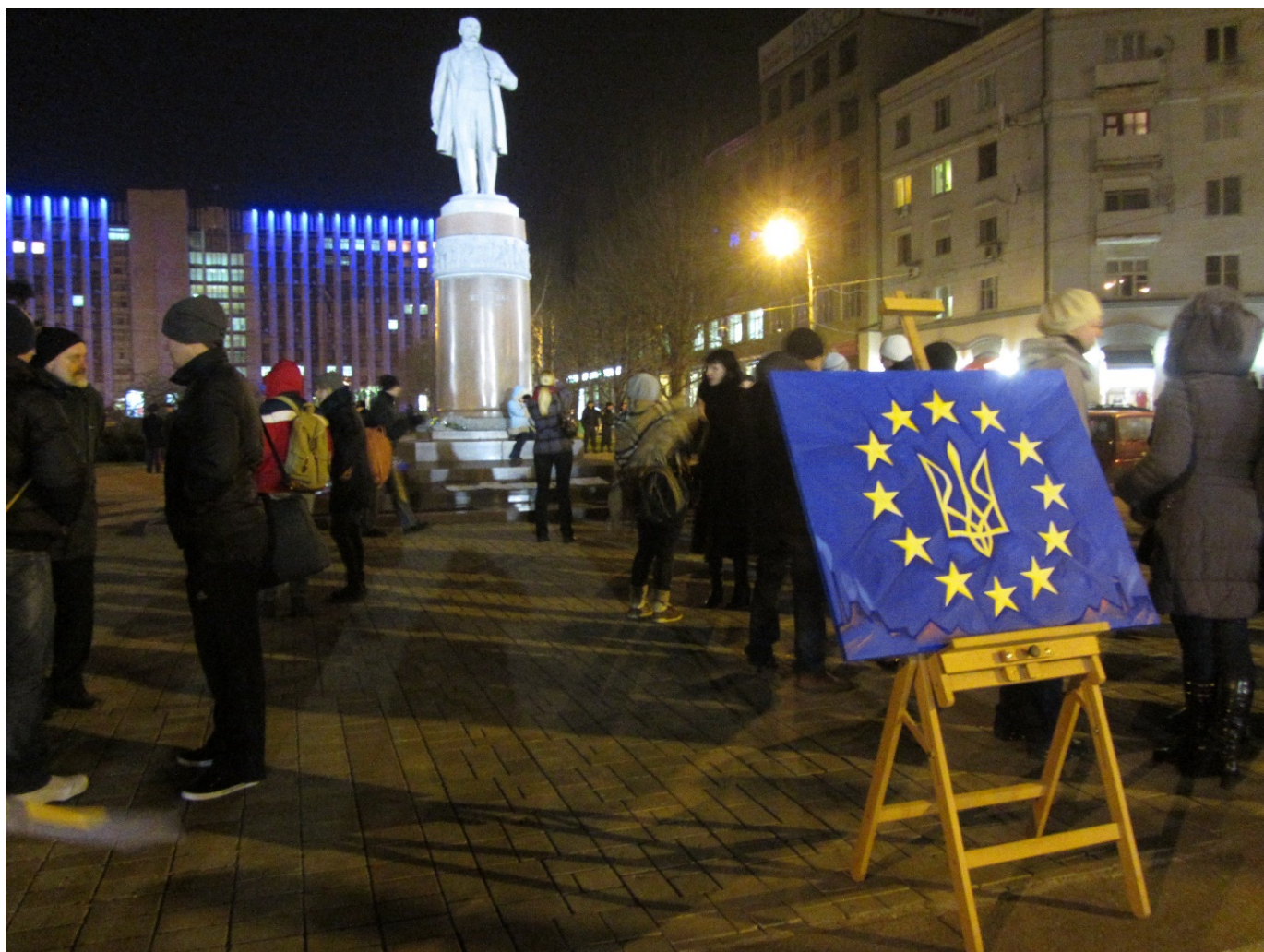
Євромайдан у Донецьку. 25 листопада 2013 року. Ізколекції НМРГ

Акції з вимогою підписати Угоду про асоціацію з ЄС відбулися також у багатьох країнах світу, де жили українці. Зокрема українська діаспора Італії, Франції, Німеччини, Великої Британії, Чехії, Польщі, США та Канади 23–24 листопада організувала мітинги, на яких люди висловлювалися на підтримку Євромайдану та виступали за укладення Угоди про асоціацію.