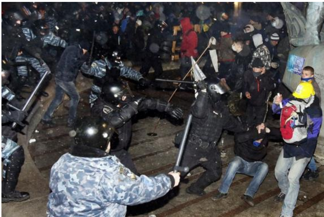
Побиття мітингувальників біля монумента Незалежності в ніч на 30 листопада 2013 року.

Офіційною причиною розгону Євромайдану назвали підготовчі роботи з установа традиційної новорічної ялинки в центрі Києва.