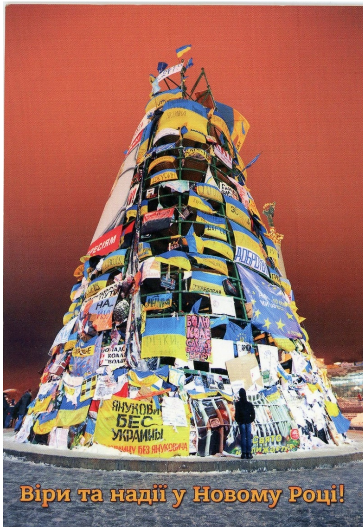
Новорічна листівка з майданівською ялинкою.

До загострення ситуації у січні 2014 року символом Майдану як місця, де збиралися культурні й освічені люди, європейці за духом, було піаніно Майдану . Його ставили перед силовиками, а відчайдушні музиканти виконували на ньому різні музичні композиції.