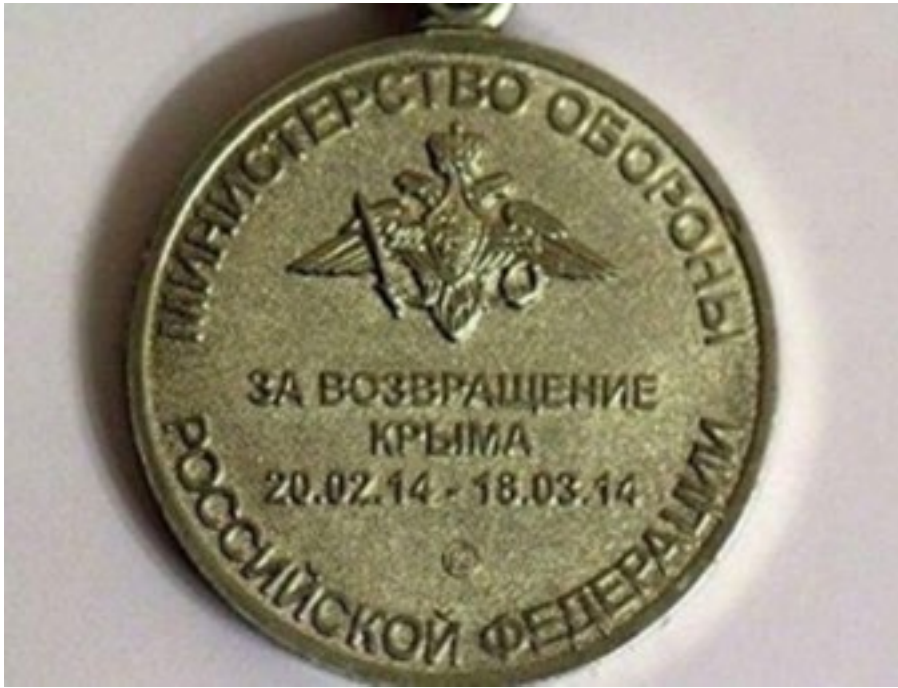
Медаль министерства обороны росії «За повернення Криму. 20.02.14 – 18.03.14»

Проте відлуння Майдану виявилось потужним: намірам росіян окупувати Кримський півострів намагалися перешкодити кримськотатарські та українські активісти. 26 лютого на ініціативу Меджлісу в Сімферополі перед будівлею Верховної Ради АР Крим відбувся мітинг, до якого приєдналися проукраїнські активісти. Їм удалося заблокувати будівлю та завадити проросійським депутатам зібрати кворум і легалізувати російську окупацію. Однак у ніч на 27 лютого будівлю кримського парламенту захопили російські військовики без розпізнавальних знаків. Почався процес «легалізації» російської окупації, який закінчився псевдореферендумом 18 березня 2014 року та анексією Криму.