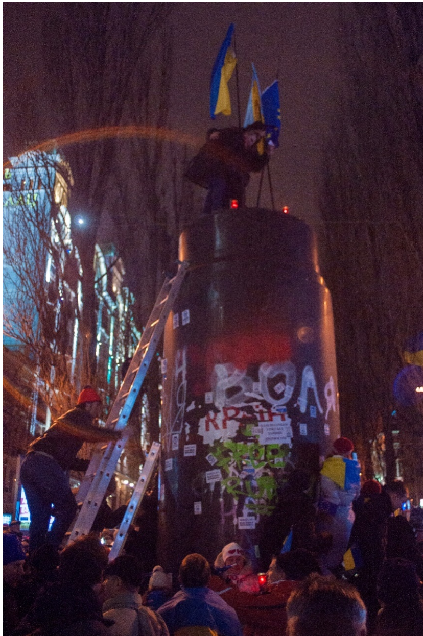
Так починався «ленінопад».

10 грудня було ініційовано перемовини у форматі круглого столу між В. Януковичем та представниками політичної опозиції. Роль умовних арбітрів мали відіграти попередники Януковича на президентській посаді – Леонід Кравчук, Леонід Кучма та Віктор Ющенко.