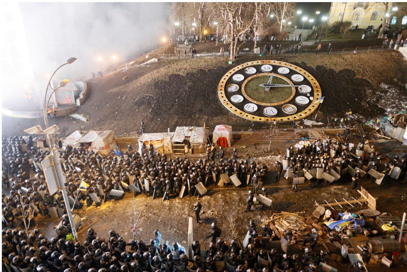
Штурм Майдану. Вечір 18 лютого 2014 року.