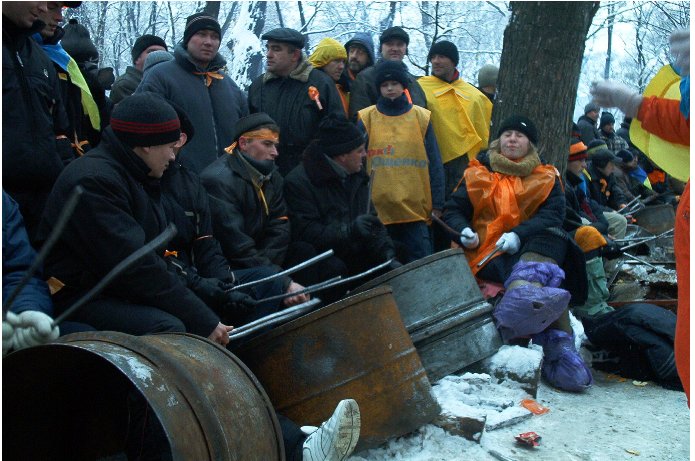
Барабанщики Помаранчевої революції.

Оригінальним виявом творчого духу Майдану стали «барабанщики революції» – група людей, які навпроти будівлі Кабінету Міністрів України стукали в металеві бочки, що залишилися в Маріїнському парку після мітингів прихильників Януковича.