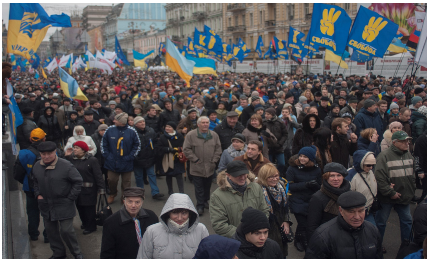
Учасники маршу 1 грудня 2013 року.

1 грудня спершу на Михайлівській площі, а потім біля пам'ятника Тарасові Шевченку в Києві почали збиратися тисячі людей. Звідти колони учасників акції маршем рушили до майдану Незалежності. За різними даними, участь у марші взяли від 500 тисяч до 1 мільйона осіб з усієї України.