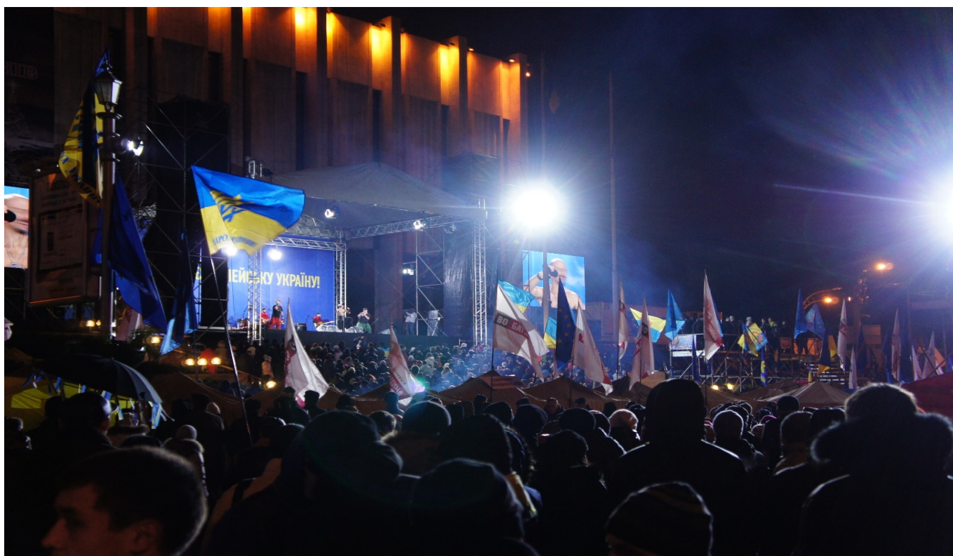
Політична опозиція на Європейській площі.

Ближче до вечора на Європейській площі постало наметове містечко прихильників євроінтеграції. Комендантом містечка було обрано Андрія Парубія. Силовики намагалися «зачистити» табір мітингувальників, почалися сутички, під час яких правоохоронців відтіснили до готелю «Дніпро».