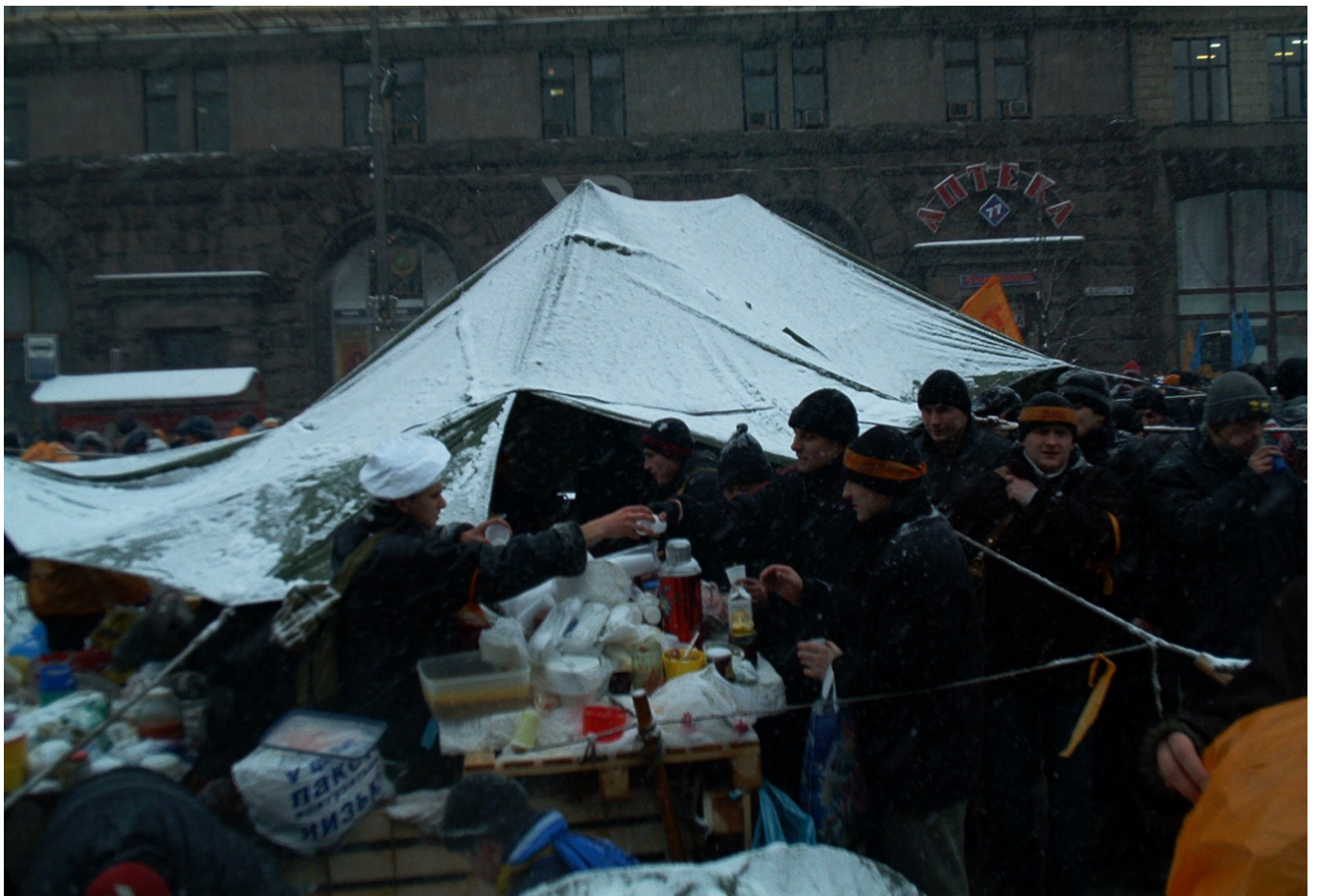
Кухня на Майдані.

Серед громадських ініціатив одну з провідних ролей під час Помаранчевої революції відіграла організація «Пора!», утворена ще на початку 2004 року з метою контролю виборчих процесів.