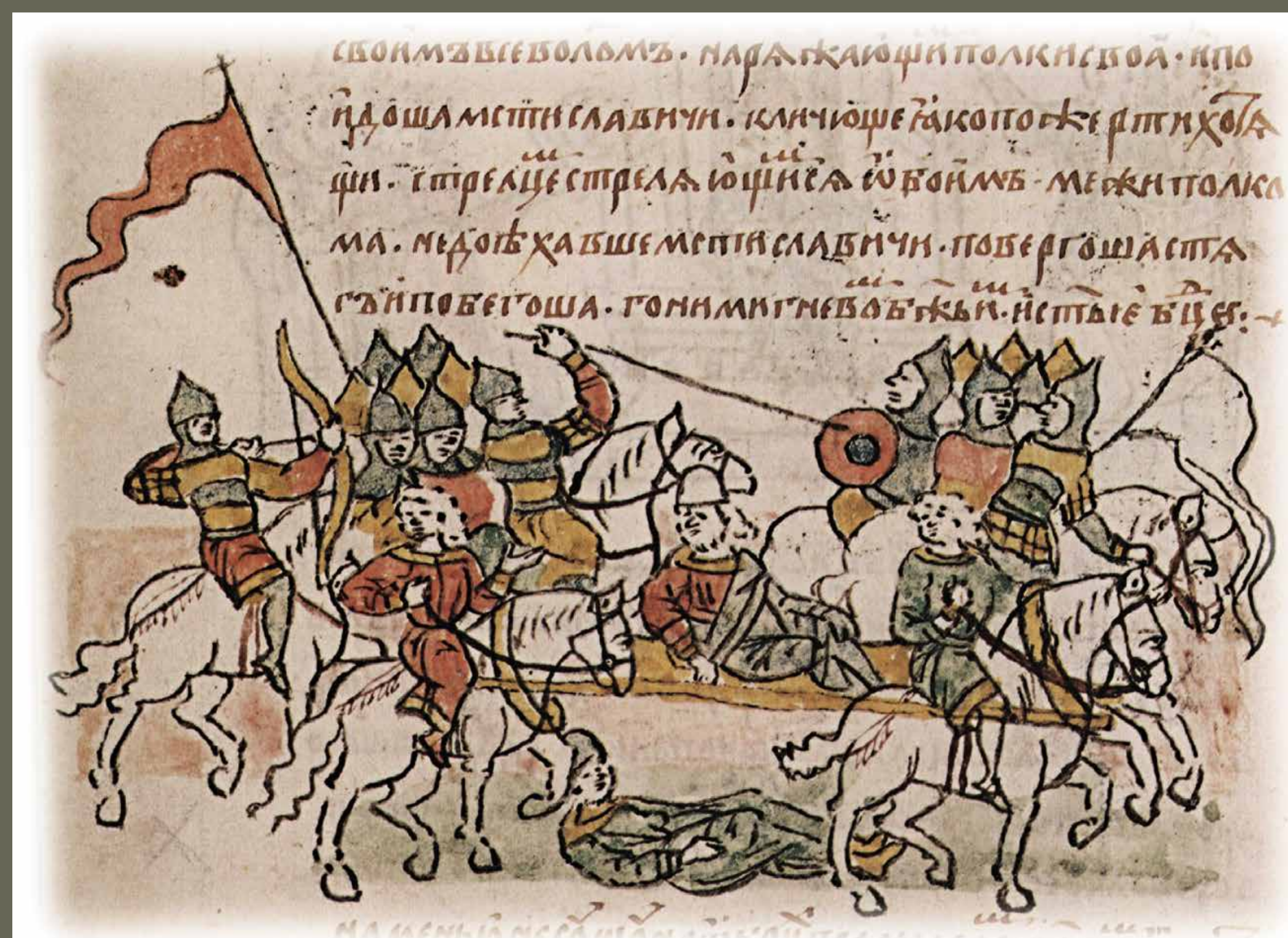
Ілюстрація до "Повісті временних літ" – найдавніший відомий руський літопис, складений у Києві в XI – на початку XII ст.