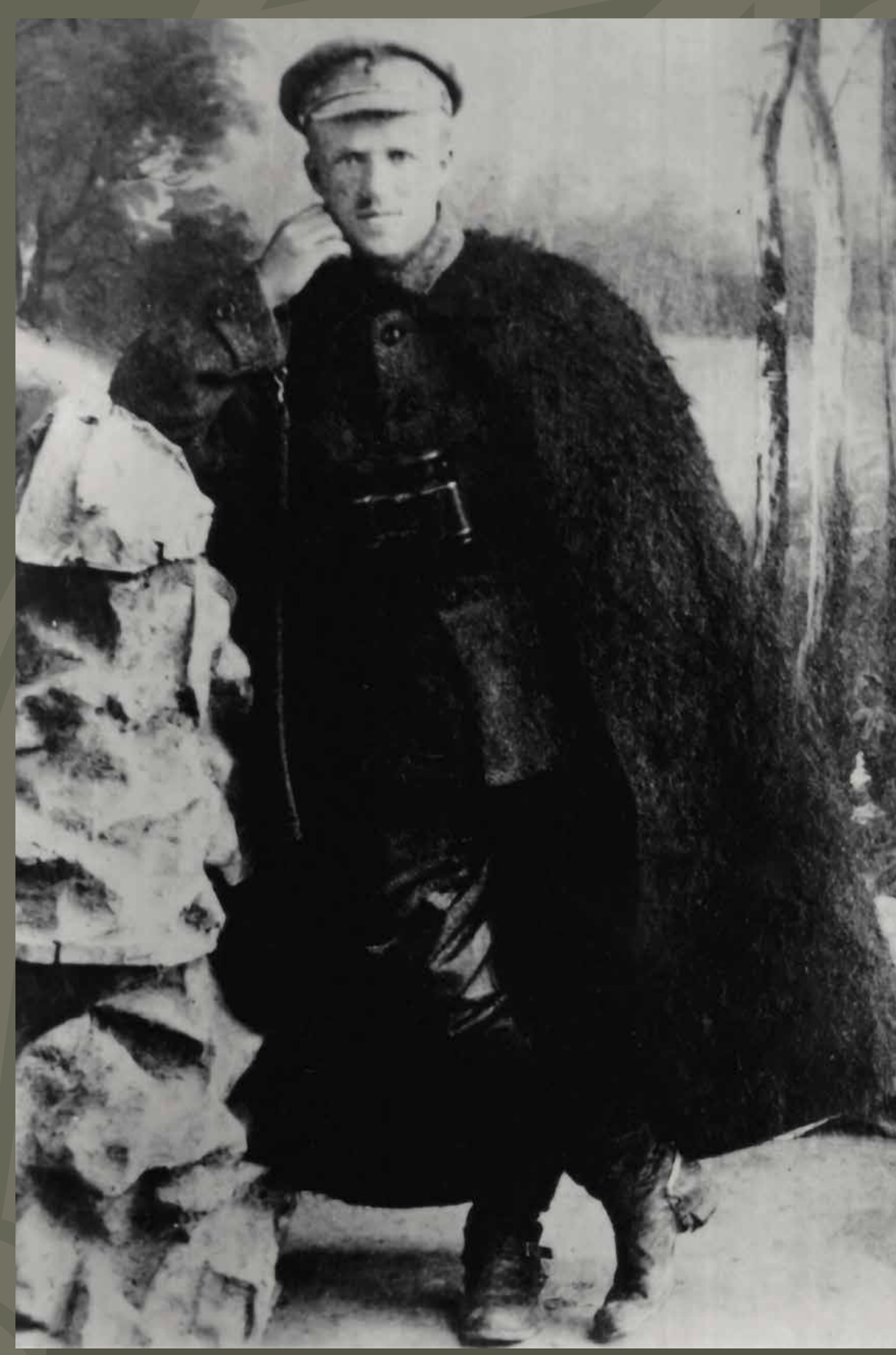
Юрко Тютюнник У 1918 р. – отаман Звенигородського коша Вільного козацтва, згодом генерал-хорунжий Дієвої армії УНР, начальник Партизансько-повстанського штабу.

7 березня 1918 року загони Вільного козацтва на чолі з Юрком Тютюнником розгромили більшовицькі війська, очолені Муравйовим, у запеклому цілоденному бою на залізничній станції, що у той час називалася Бобринською, а нині імені Тараса Шевченка біля Сміли.