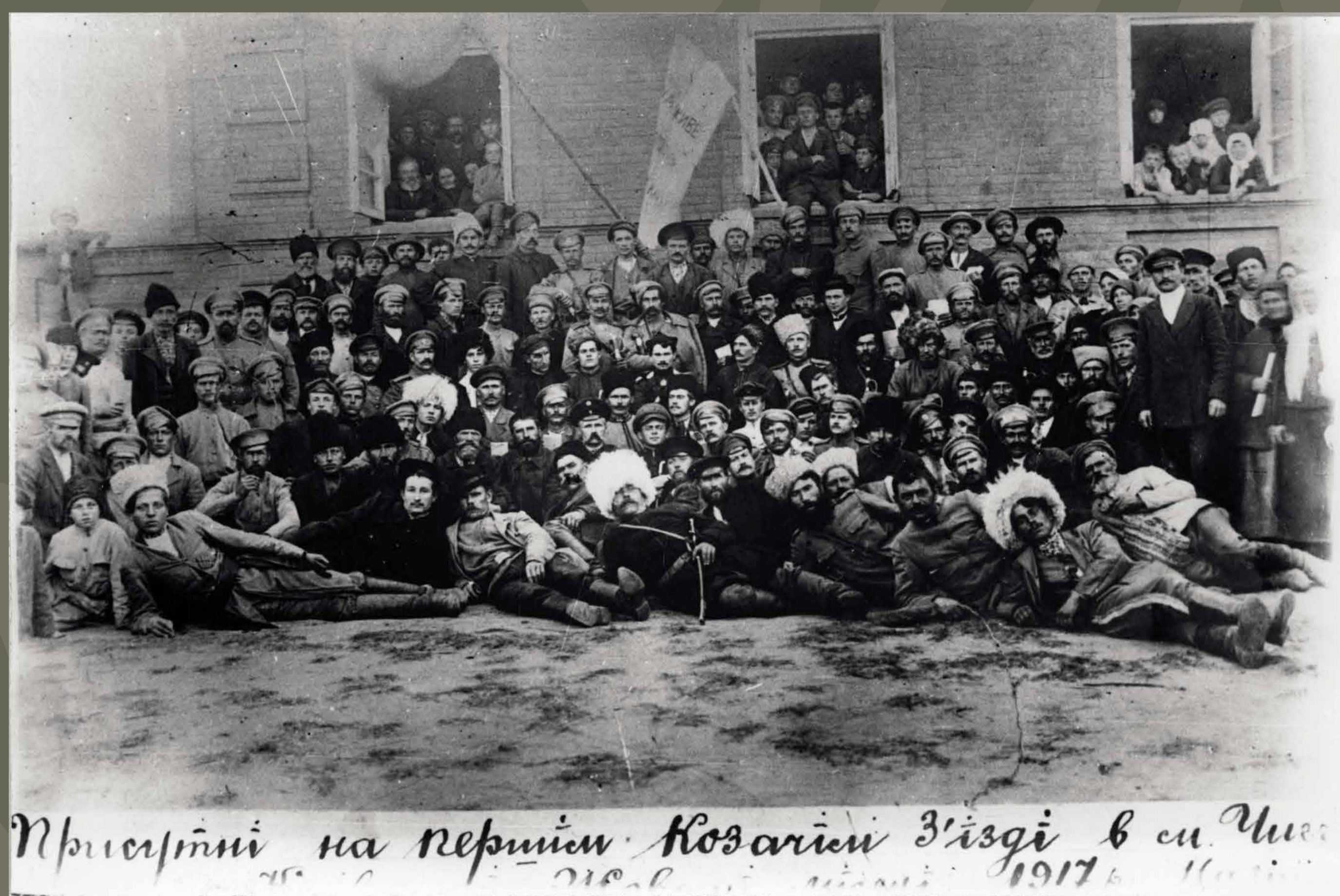
Учасники з'їзду Вільного козацтва у м. Чигирин, жовтень 1917 р.

Вільне козацтво зародилось весною 1917 року для захисту українських сіл і міст від усяких заброд та оборони «вольностей українського народу». Вільне козацтво формувались як територіальна самооборона на козацьких традиціях з виборною старшиною. Основною одиницею були сотні, які створювалися у селах і містах. Сотні об'єднувалися у курені; курені (у межах повітів) – у полки; полки (у межах губерній) – у коші.