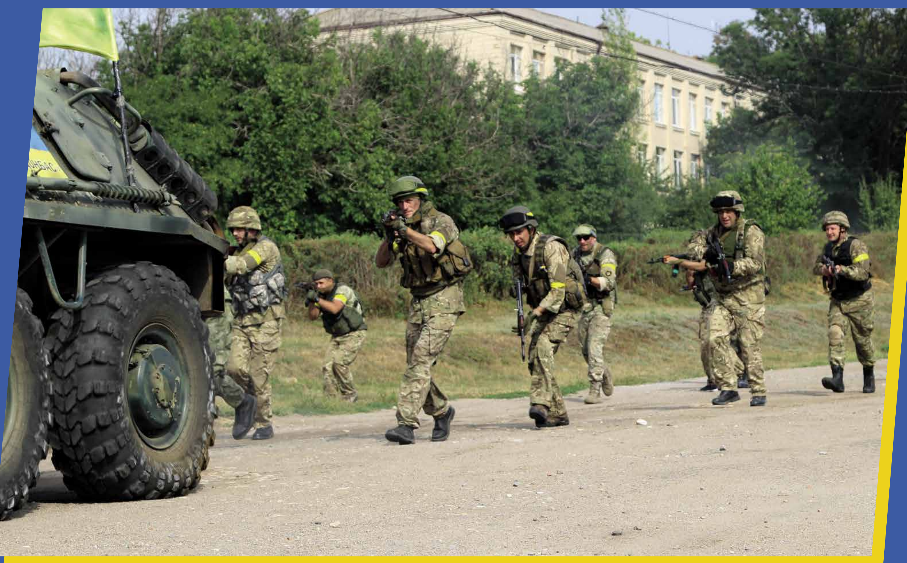
Про перших добровольців знято фільми "Добровольці Божої чоти", "Війна за свій рахунок", "Кіборги", "Іловайськ 2014. Батальйон "Донбас". На фото – кадр із останнього фільму

У травні 2014 року в рамках часткової мобілізації, викликаній російською агресією, було прийнято рішення про створення в кожній області батальйонів ТрО, які входили до складу ЗСУ та підпорядковувалися Міністерству оборони України. Пізніше більшість із них брала активну участь в Антитерористичній операції проти російських регулярних військ та їхніх найманців на Донбасі, звільняючи захоплені окупантами міста.