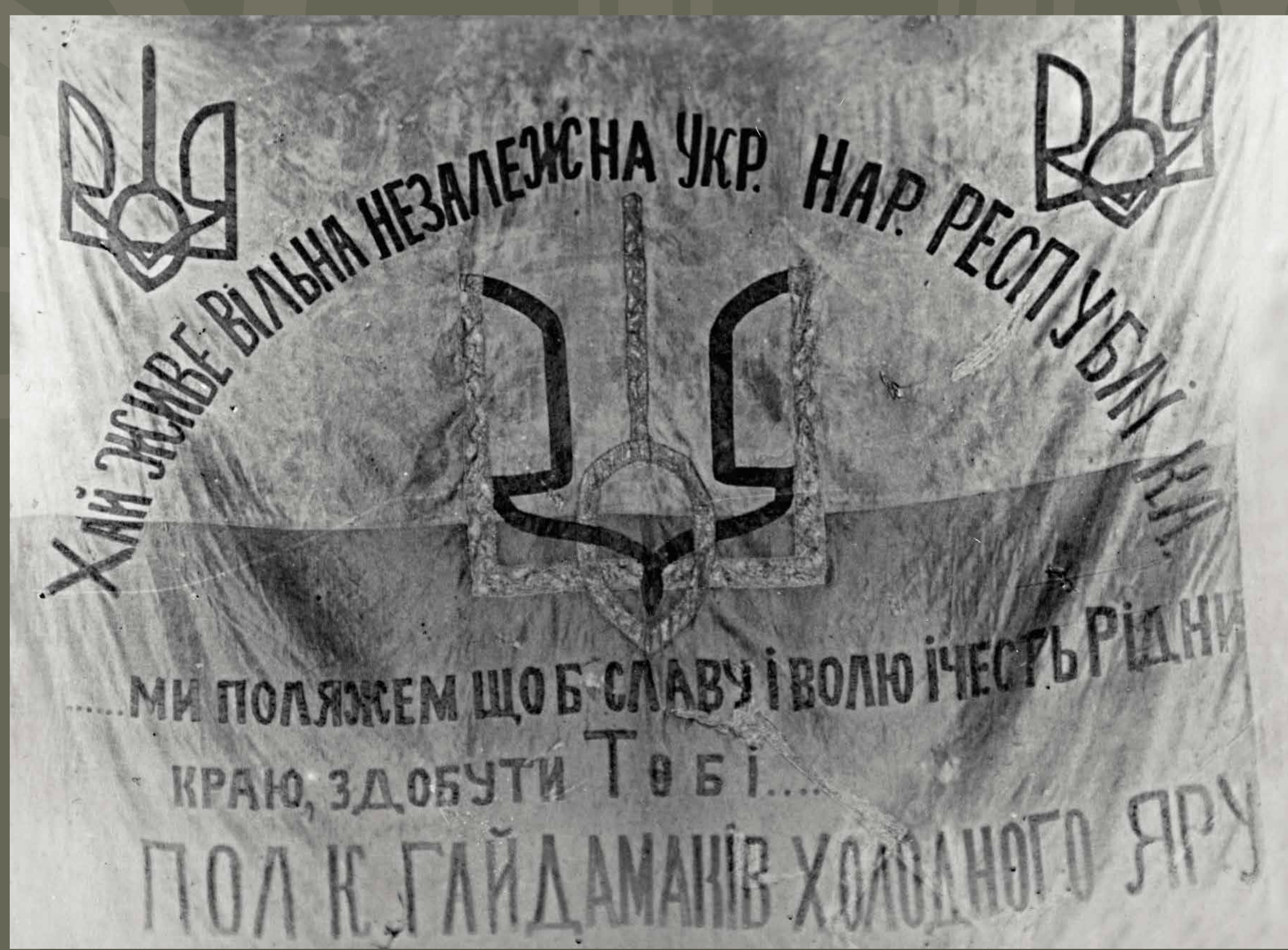
Прапор полку гайдамаків Холодного Яру.

У наступні роки значна частина Вільного козацтва доєдналась до Дієвої армії УНР чи продовжувала боротись із окупантами у повстанських загонах.