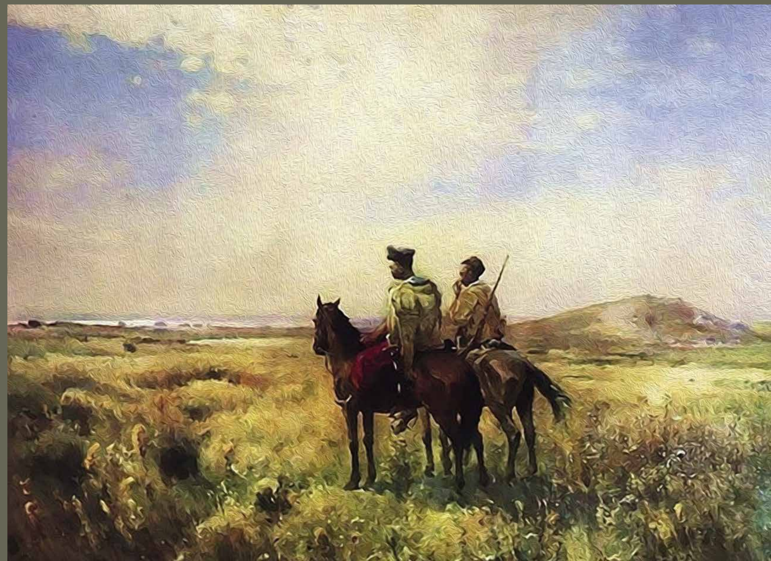
Сергій Васильківський (1854 — 1917). «Козаки в степу (Сторожа Запорозьких вольностей)», 1890 р.