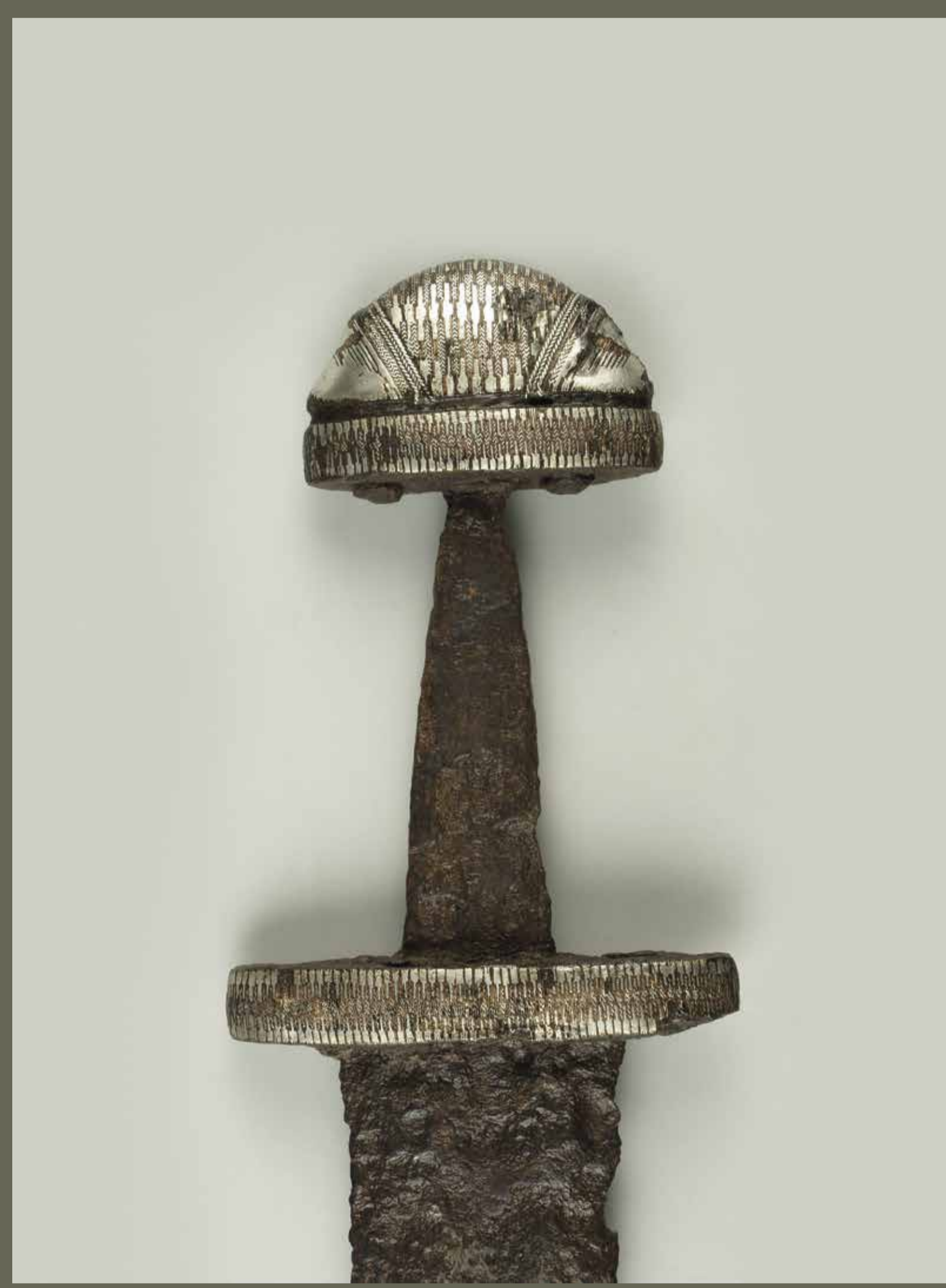
Меч. Друга половина X ст. Шестовиця, Чернігівська область. Розкопки П.І. Смолічева, 1926 р.

Основою війська в Русі була дружина, до складу якої входили професійні воїни. Свої дружини мали великий (київський) князь, удільні князі та бояри (великі землевласники). Вони забезпечували воїнів житлом, харчами, одягом, зброєю та військовим спорядженням. За службу дружинники отримували грошову винагороду та право володіння землею. Обов'язки дружинника з часом стали переходити від батька до сина.