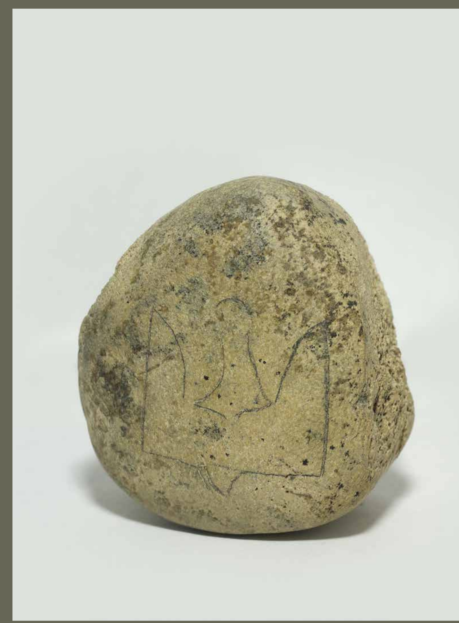
Кістень XI ст. зі знаком Ярослава Мудрого. Ріп. Розкопки 1984 р. в Чернігові.

Під час ворожих нападів скликалося загальне народне ополчення (вої) — фактично місцева самооборона. До ополчення входили всі чоловіки міста та навколишніх сіл, незалежно від соціального становища та віку. Їх формували та скликали за територіальним принципом.