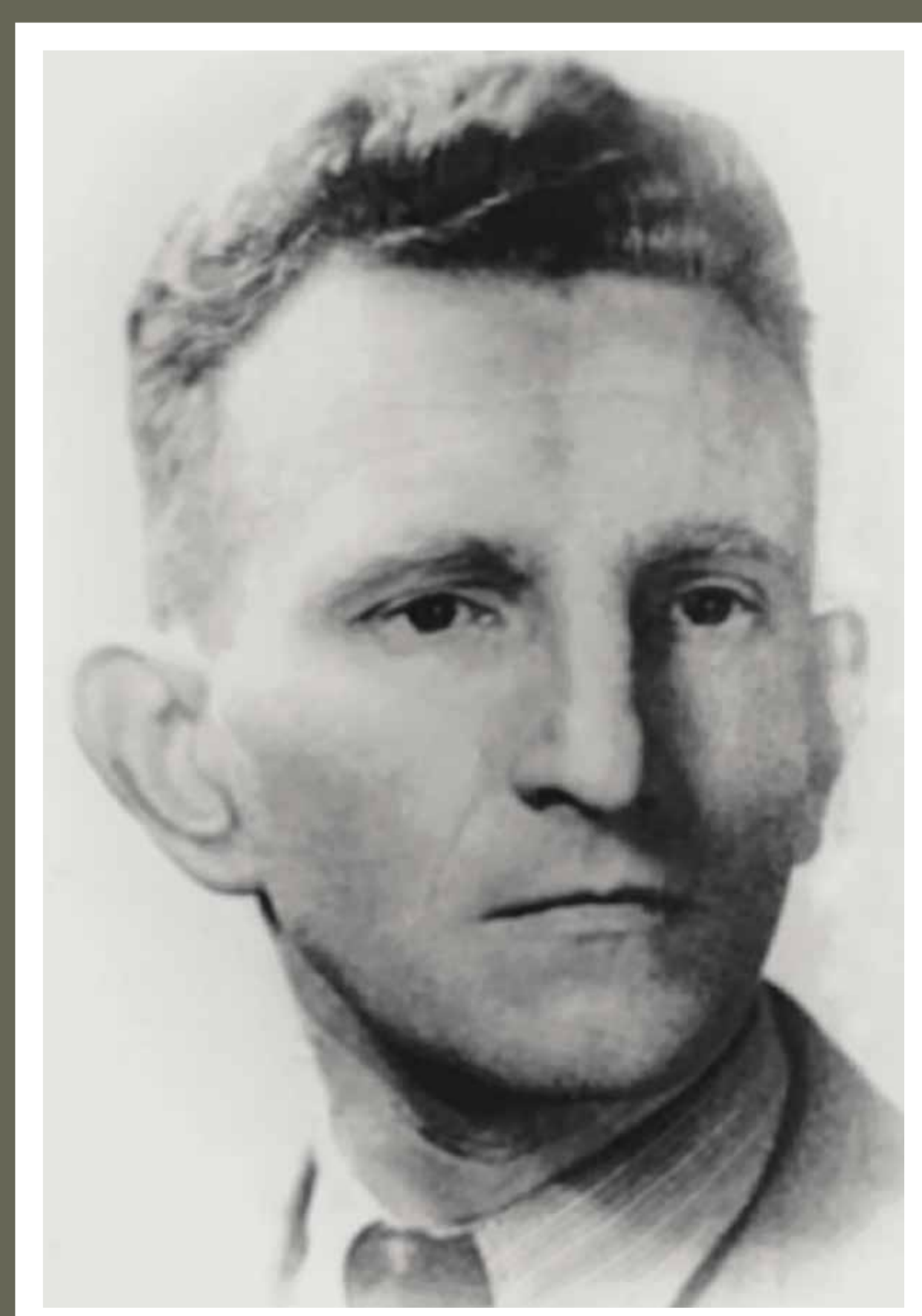
Роман Шухевич – український політик і державний діяч, військовик. Член галицького крайового проводу Організації українських націоналістів

Головним ворогом УПА вважала СРСР як державу, що проводила «денацифікацію» українського народу, завдаючи найжахливіших втрат через масові політичні репресії, голодомори, депортації населення.