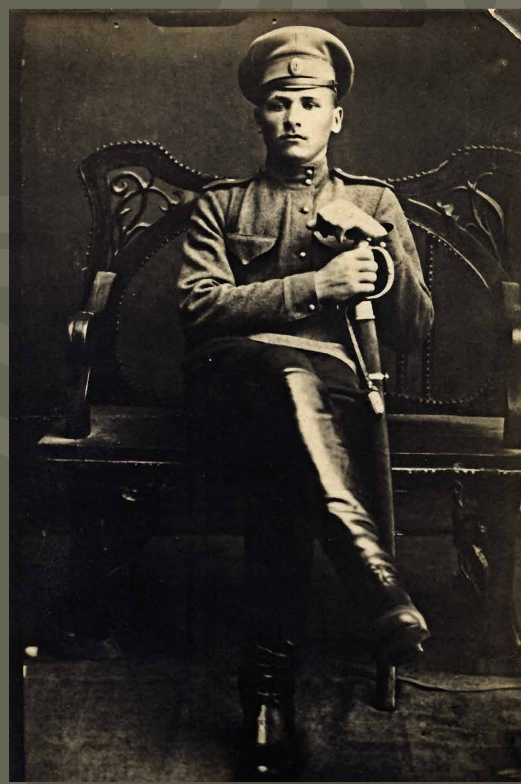
Василь Чучупак У 1919–1920 рр. командир полку гайдамаків Холодного Яру, головний отаман Холодноярської Республіки.

Загони самооборони українських сіл тривалий час чинили спротив окупантам, перетворюючи свої села і місцевості на своєрідні республіки. Найвідомішою з них є Холодноярська республіка. Вона зародилась із сотні самооборони села Мельники і стала символом нескореності українського духу.