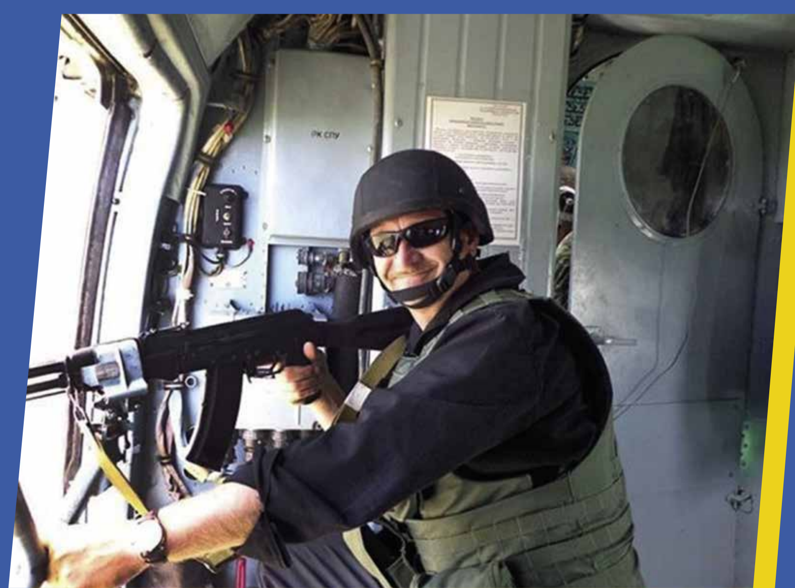
Сергій Кульчицький Герой України

14 березня – День українського добровольця