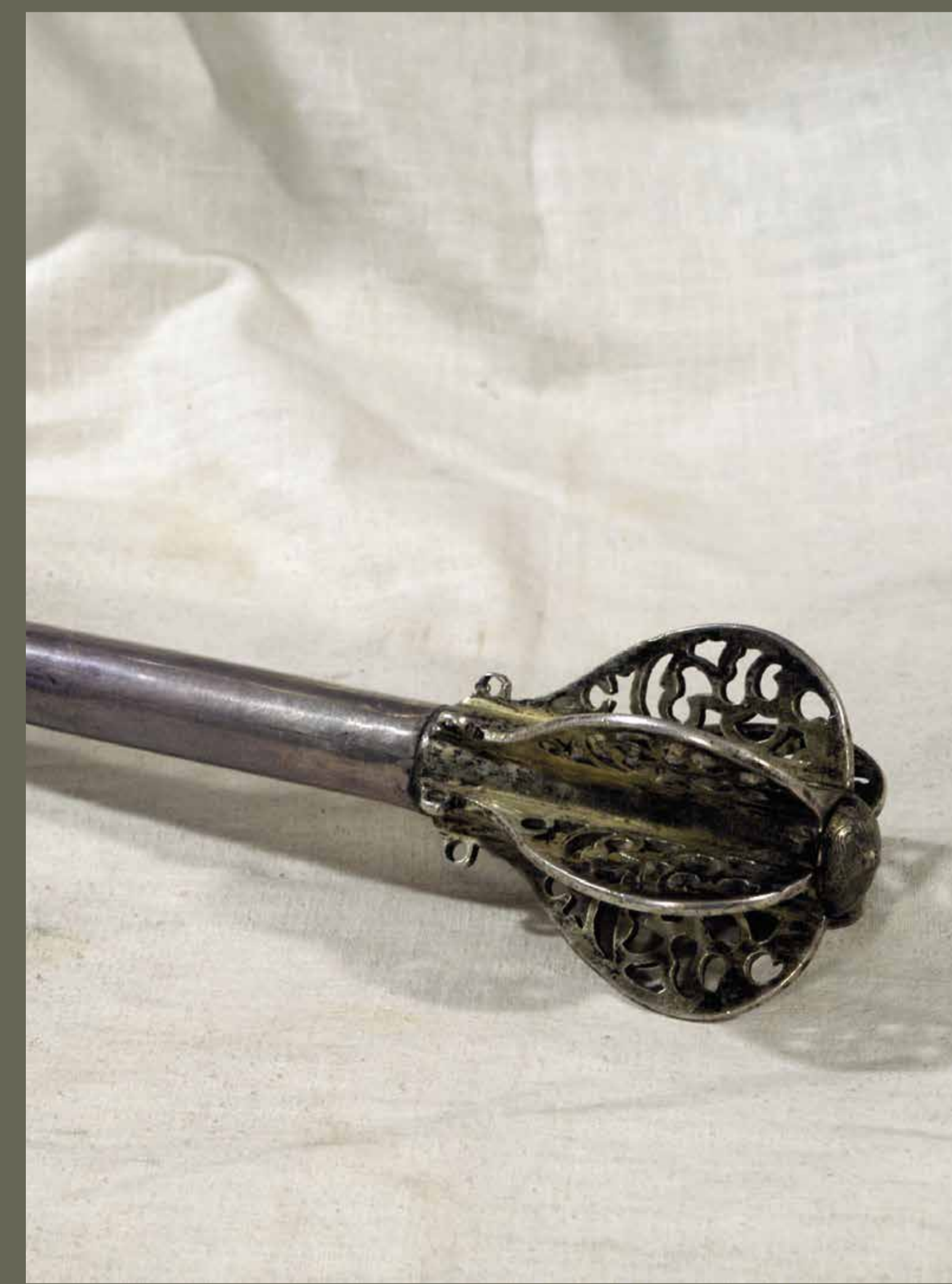
Пернач чернігівського полковника П.Полуботка. Початок XVIII ст. Срібло. З колекції Василя Тарновського.

Козак – насамперед воїн. Універсальний, витривалий, готовий до швидкої зміни обстановки, з вірою в себе та силу товариства.